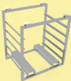
Стеллаж обсушки сыра