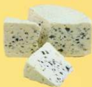
ВЫЗРЕВАНИЕ СЫРА С ПЛЕСЕНЬЮ