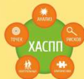
ОБЕСПЕЧЕНИЕ ТРЕБОВАНИЙ РАСС