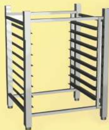
Стеллаж вызревания сыра

Легкая версия сайта: www.mpt-krasnodar.ru