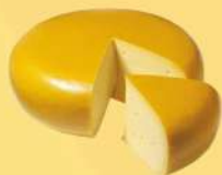
ВЫЗРЕВАНИЕ СЫРА С ВОСКОВЫМ ПОКРЫТИЕМ