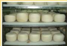
ПОСОЛКА И СУШКА НА КОНТЕЙНЕРЕ